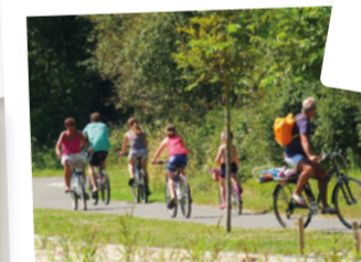
LES PISTES CYCLABLES