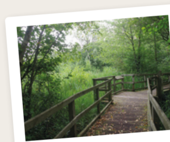
LE DOMAINE DU ROHART