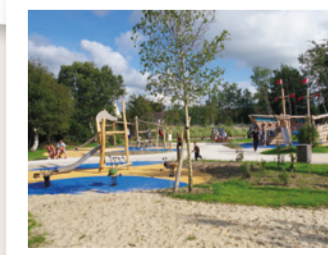
LE PARC DE LA CHAUMIÈRE

Informations non contractuelles - Liste non exhaustive - Contactez l'Office de Tourisme pour connaître l'ensemble des acteurs économiques et touristiques de la commune.