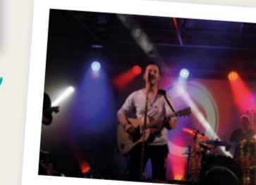
LES RENDEZ-VOUS MUSICAUX DE L'ÉTÉ