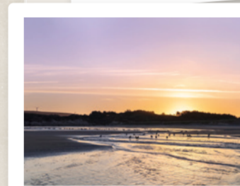
LES PROMENADES SUR LA PLAGE